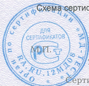
Схема сертификации 2.

Протокола проверки результатов услуг № 190416 от 14.09.2019