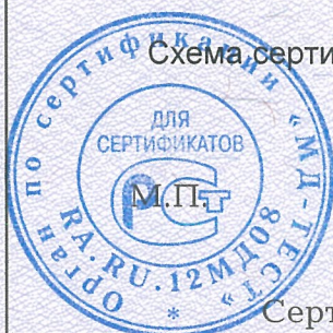
Схема сертификации 2.

Протокола проверки результатов услуг № 170063 от 24.03.2017