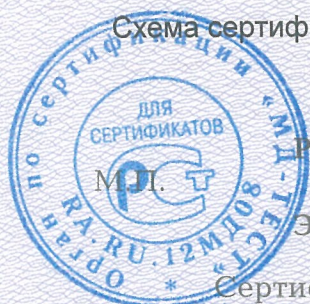
Схема сертификации 2.

Протокола проверки результатов услуг № 190350 от 19.08.2019